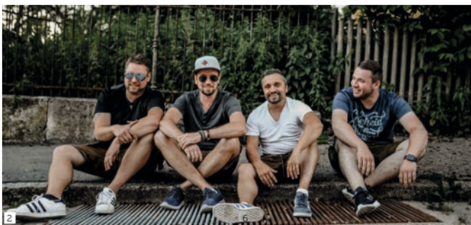
Copyrights: Mia und da ander