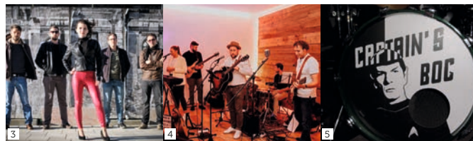
Copyrights: Soundlikeflow, Kapuze